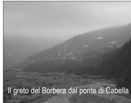
Il greto del Borbera dal ponte di Cabella

Scendendo verso Sisola, in alto alla nostra destra si scorge appena il paese di Sant’Ambrogio, prima sede del distaccamento Franchi alla fine di settembre del ’44. A fianco, Bregni, dove ai primi di dicembre del ’44 nacque anche il 3° distaccamento del