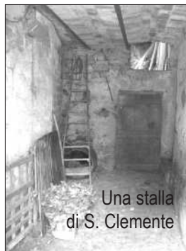
Una stalla di S. Clemente