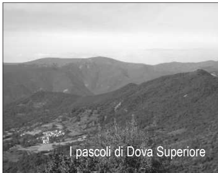
I pascoli di Dova Superiore

San Clemente fa da sfondo ad un piccolo aneddoto, curioso ed eloquente, che svela la tollerante umanità del comandante Aldo Gastaldi. Bisagno , sincero cristiano, durante la militanza partigiana non si rese protagonista di manifeste esternazioni di fede; si conoscono piuttosto episodi caratterizzati da riservatezza e discrezione, in linea con il suo carattere: “un momento di pausa, seduti su un prato coi partigiani del distaccamento Balilla. Ad un certo momento un ragazzo giovane ha tirato giù una bella bestemmia. Bisagno che gli era seduto un po' dietro, gli ha applicato il piede sul sedere, mimando l'atto di dargli un calcione, ma senza parole e sorridendo” 1 .